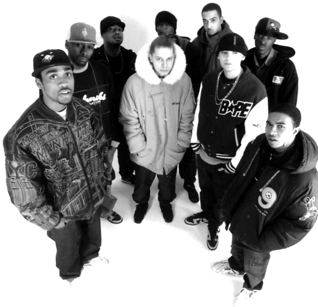
Roll Deep Crew

Live, 15.01.2005, Dachstock Reitschule (Berne)